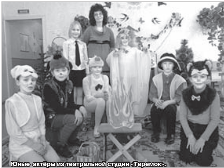
Юные актёры из театральной студии «Теремок».

Главный герой сказки «Зайка-Зазнайка» — ушастый зайчишка, хотел казаться выше, умнее, лучше всех. Но, вместо того, чтобы учиться быть таким, он лишь хвастался на каждом шагу. В результате чего попадал в такие передряги, которые учили его сообразительности, скромности, а еще — необходимости уметь дружить, не обижая тех, кто рядом. Эта поучительная и остроумная история преподнесет не один житейский урок не только