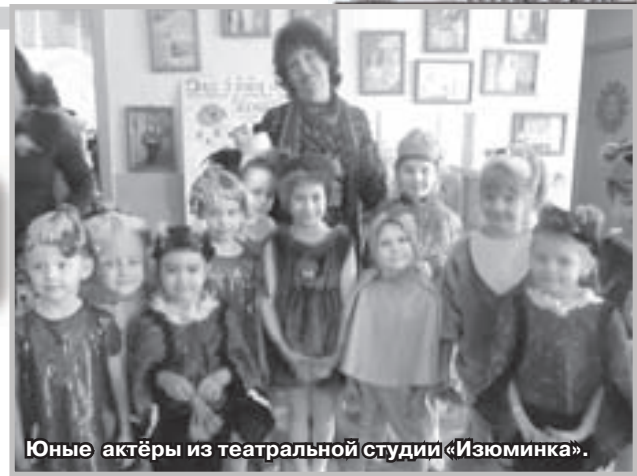
Юные актёры из театральной студии «Изыюминка».

Родители порой беспокоились, что-то долго задерживаются их чада на занятиях в студии. И невдомёк им было, что ребята не только занимались сказкой, но и обсуждали важные школьные проблемы, готовили вместе трудные уроки, получали консультации, как лучше написать домашнее сочинение, иногда за чашкой чая спорили о прочитанных книгах, просто об-